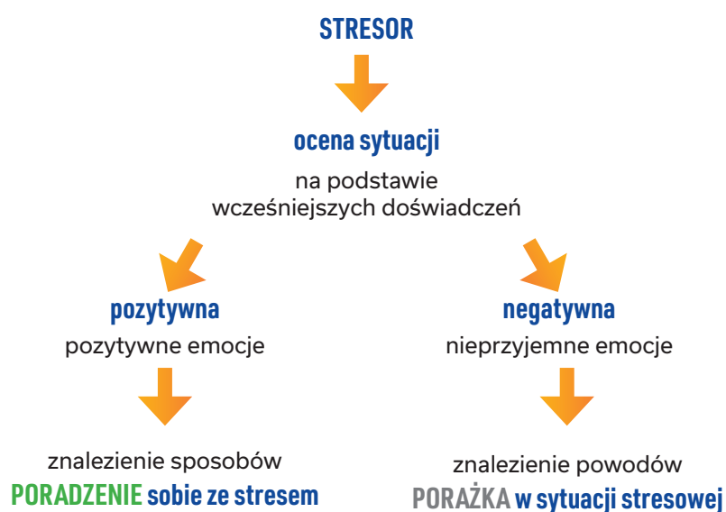
Ryc. 2. Interpretacja sytuacji stresowej 4

Jeśli nierealistyczne przekonania nie są Ci obce, postaraj się z nimi walczyć. Kiedy pojawiają się w Twojej głowie, powiedz swoim myślom: „STOP”. Staraj się też zastępować je myślami budującymi (patrz: tabela nr 2).