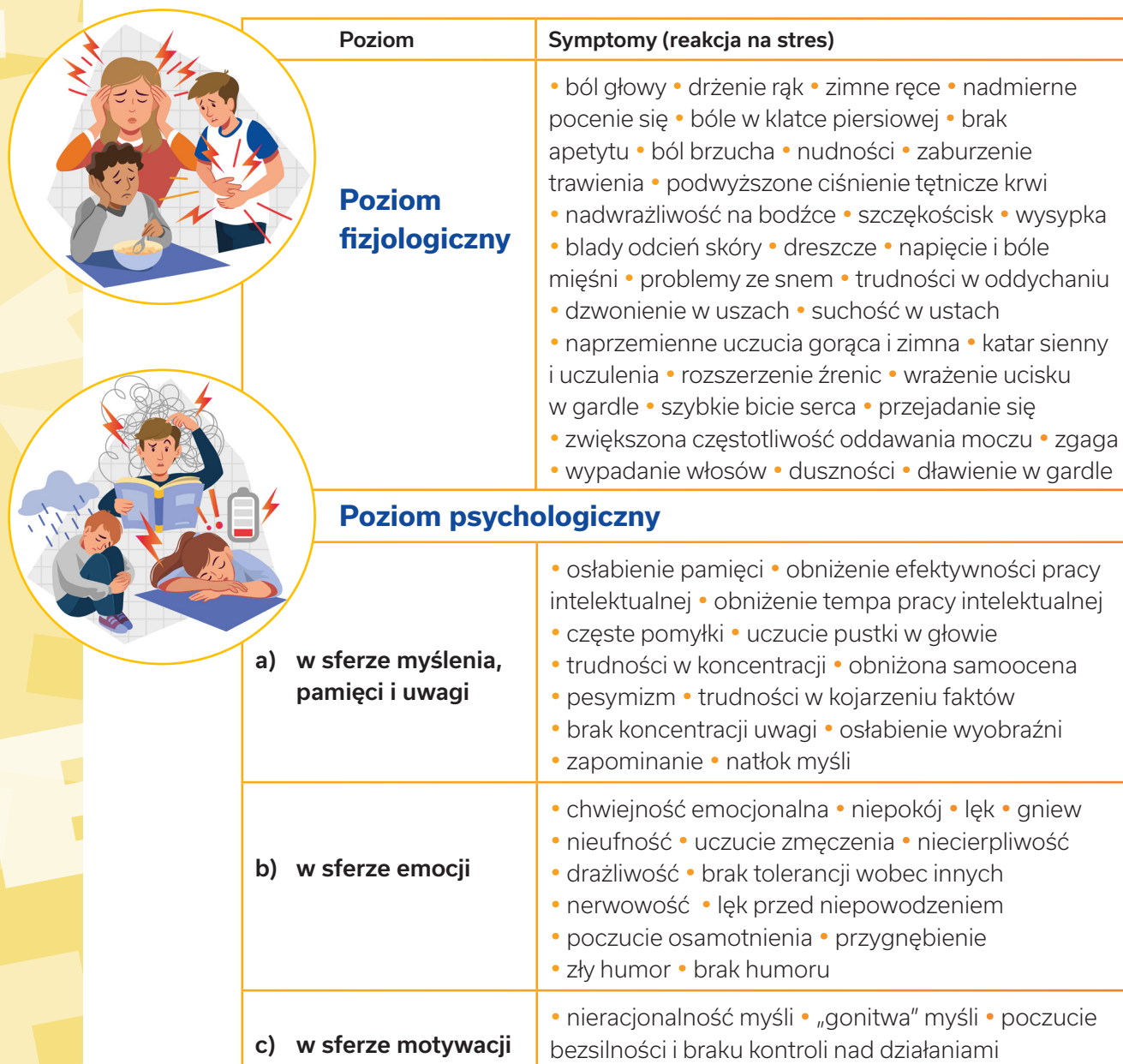
Tabela 1. Reakcja na stres egzaminacyjny

Warunkiem radzenia sobie ze stresem egzaminacyjnym jest umiejętność szybkiego rozpoznawania niepokojących symptomów, rozumienia ich i zmieniania tego, co zagrażające. Twoim zadaniem jest pomóc dziecku w ich rozpoznawaniu, wówczas łatwiej mu będzie nauczyć się kontrolowania sytuacji stresującej i szybkiego rozładowywania napięcia. Wiedza o symptomach stresu umożliwi nam znalezienie skutecznych strategii i metod radzenia sobie z każdym typem stresu egzaminacyjnego.